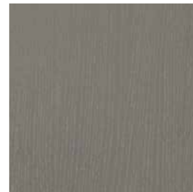
G. Grote houtnerf

Deze folie glanst minder dan een gelijkaardige folie in Granulé en is met een realistische gelakte houtlook een nog steeds populaire keuze.