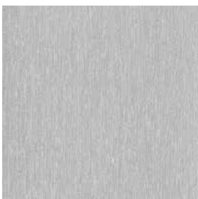
E. Mini houtnerf

Deze populaire folie geeft een staal-aluminium look. Creëer een industrieel-strak raam of een steel look variëteit in combinatie met de juiste profielen.