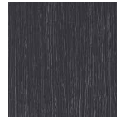
H. Verweerde houtnerf

Deze exclusieve folie met gelakte houtlook is verkrijgbaar in 5 pastelkleuren en past perfect bij een landelijke stijl.