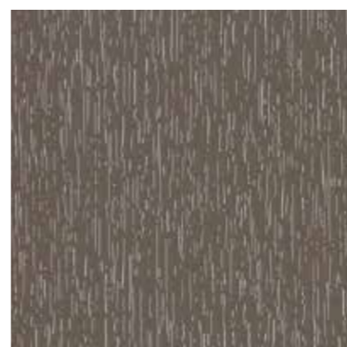
F. Normale houtnerf

Geeft een brushed aluminium look en is populair om een zeer strak raam te creëren. De keuze is beperkt tot zilver metallic, geborsteld aluminium en platinum.