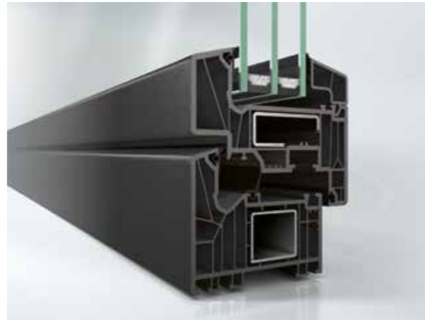
ADVanced PLANA met donkergrijze kern.

Met ADVanced neem je geen genoegen met standaard, maar kies je voor een high-end afwerking van je kunststof ramen en deuren, binnen én buiten.